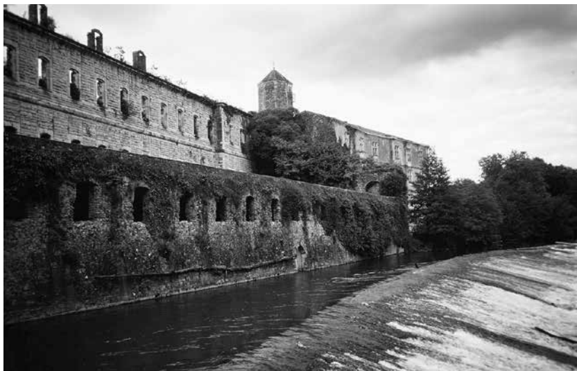
L'abbaye Saint-Jean-Baptiste de Sorde.