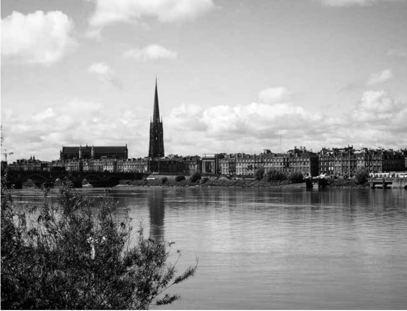
Vue de la cathédrale Saint-Michel, en entrant à Bordeaux.

répondit l'ange. Le bâton fleurit sur le champ. Seurin de Bordeaux est connu comme l'évêque au bâton fleuri.