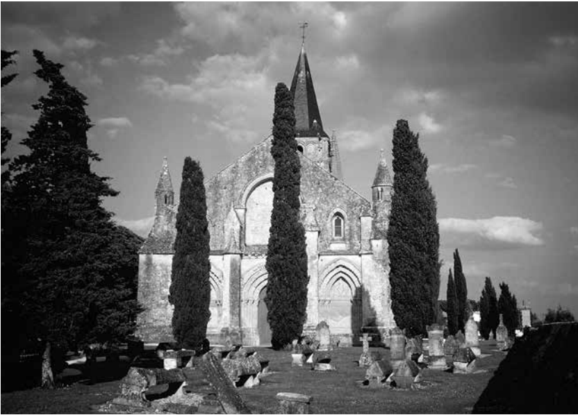
L'église Saint-Pierre d'Aulnay, chef-d'œuvre exemplaire de l'art roman.

Avant de partager le souper chez lui, Claude Bourland m'amène visiter l'église Saint-Pierre d'Aulnay, chef-d'œuvre exemplaire de l'art roman.