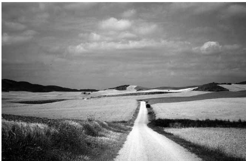
Champs de maïs, dans les environs de Los Arcos.

Sainte-Anne-de-Beaupré ou l'inverse, le point médian étant la basilique de Notre-Dame-du-Cap. Il s'agirait d'établir, le long de l'itinéraire choisi, un réseau de villes-étapes offrant un lieu d'hébergement pour les pèlerins. Chacun serait conçu et administré par un comité local constitué de personnes intéressées (administration municipale, gens de la pastorale, gens d'affaire, laïcs, etc.) Il va de soi qu'un organisme sans but lucratif devrait être créé pour promouvoir le projet et coordonner le déroulement harmonieux des différentes phases de sa réalisation. Je vais continuer à approfondir cette idée.