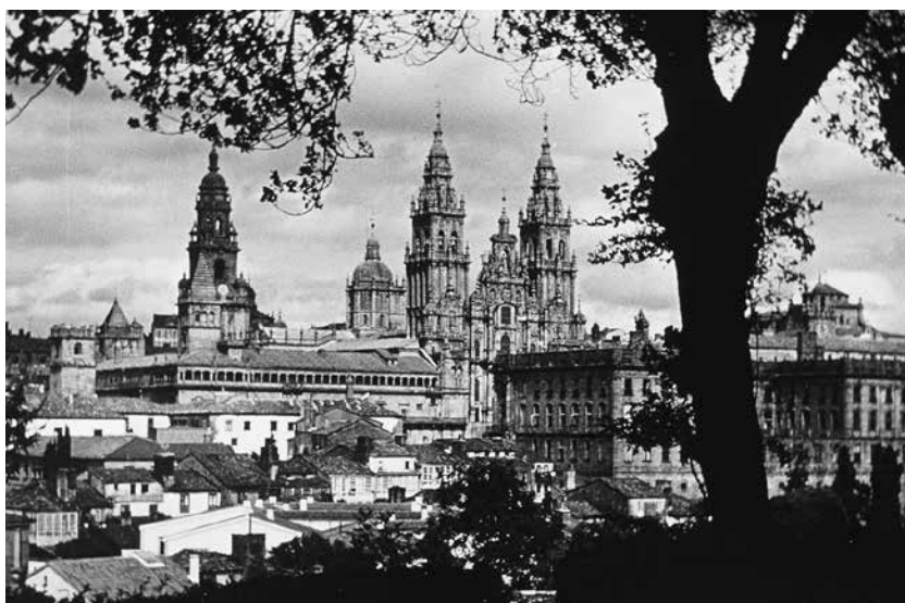
Vue générale de la cathédrale Saint-Jacques-de-Compostelle.

Le long d'une route, j'aperçois au loin, à près d'un kilomètre, une colline au sommet de laquelle je crois distinguer trois grandes statues. Cela m'intrigue et comme j'ai du temps pour flâner, je sors du camp et je me dirige vers cet endroit. Plus je m'approche et plus je m'interroge. Ne serait ce pas là le fameux Mont de la Joie ? Je me souviens, tout à coup, que le nom de l'endroit où je suis, Monte de Gozo, se traduit en français par le « Mont de la Joie ». Selon l'histoire médiévale, c'était ici que les pèlerins apercevaient pour la première fois les clochers de la cathédrale Saint-Jacques-de-Compostelle. Il semble qu'une course se faisait entre eux pour être le premier à atteindre le sommet afin de contempler la scène, la vision du but si longtemps recherché.