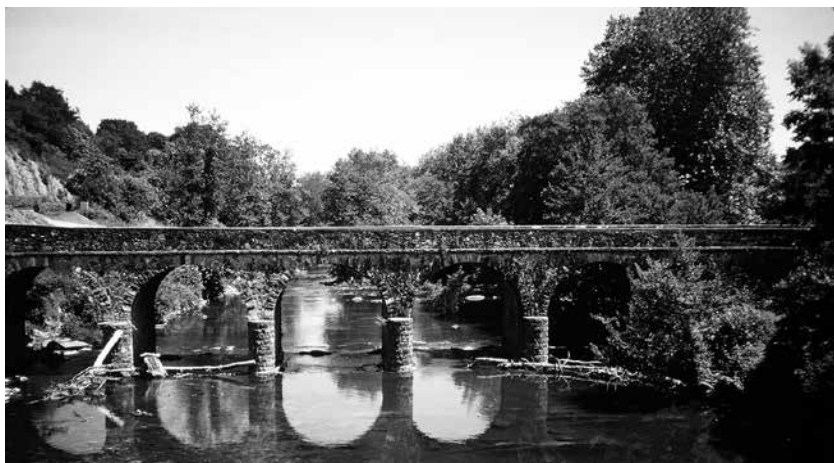
Pont moyenâgeux entre Saint-Palais et Uhart-Mixe.

Avant d'arriver à Uhart-Mixe, je traverse Saint-Palais où, à l'époque, plusieurs hôpitaux et prieurés accueillaient la foule des pèlerins. Un monastère de Franciscains pratique encore cette hospitalité pour les pèlerins modernes, qui vont à pied comme moi. Je ne m'y arrête pas, car j'ai déjà quelqu'un pour m'héberger. Un médecin de l'endroit a créé dans le centre-ville un petit musée dédié au chemin de Compostelle. Je ne m'y suis pas arrêté non plus.