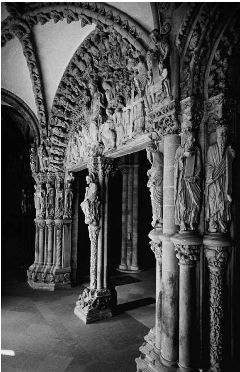
Le Portail de la Gloire.