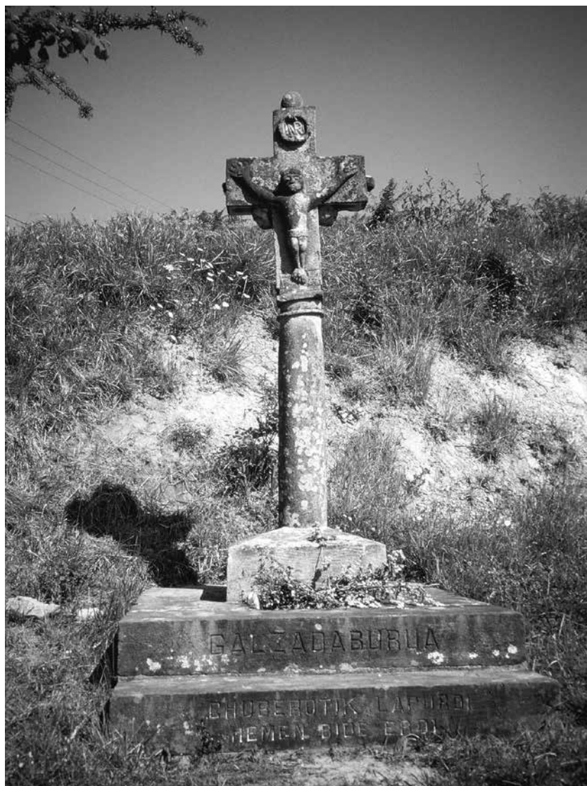
La croix de Galzadaburua, près de Uhart-Mixe.

Je sais aussi que depuis quelques années, différentes instances comme le gouvernement d'Espagne, des monastères, des mairies, différents organismes et même des mécènes, se sont concertés pour établir un réseau d'hébergement pour les pèlerins à pied. On m'avait dit que je n'avais qu'à suivre le balisage à partir de