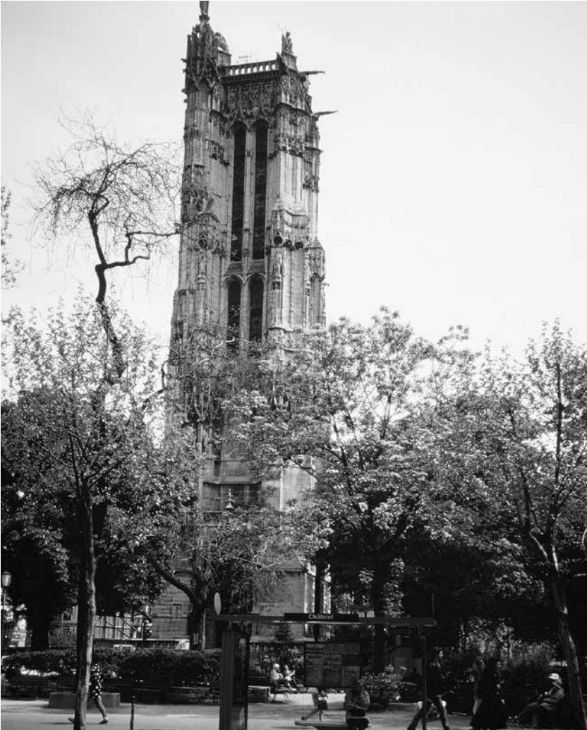
La tour Saint-Jacques, point de départ des pèlerins qui partaient de Paris.

Plusieurs touristes qui visitent Notre-Dame-de-Paris s'arrêtent devant ce confessionnal vitré. Certains sont étonnés, d'autres ne peuvent retenir leur rire. Plusieurs passent outre mais reviennent sur leurs pas comme s'ils avaient raté quelque chose. J'écoute les conversations et j'ai peine à garder mon sérieux. J'entends les remarques: « C'est un zoo, c'est un aquarium ! ». Francement, on y va fort !