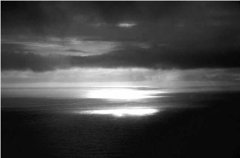
Coucher de soleil à Cap Finistère.

En fin d'après-midi, je pousse une pointe jusqu'à l'extrémité de la presqu'île. Il s'agit simplement de suivre la route sur deux ou trois kilomètres supplémentaires pour arriver à un immense phare. Un pas de plus et c'est la flotte. À partir du phare, le chemin continue à rebours en montant en zigzag vers les tours de télécommunications, au sommet de la montagne au centre de la presqu'île. J'entreprends cette ascension d'un kilomètre. Il y a un peu de brume. Tout est silence. Au sommet, la vue est claire jusqu'à l'horizon. Le paysage est magnifique. On voit la mer sur trois côtés. Je reviendrai ce soir admirer le coucher du soleil.