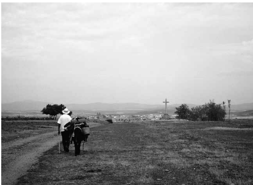
Pèlerin et son âne, à l'approche de la ville d'Astorga.