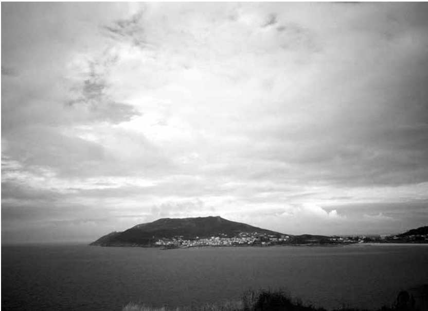
La péninsule de Finistère et la ville.