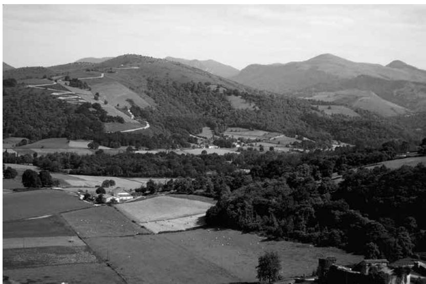
En bas, à droite, l'abbaye d'Ostabat au pied des Pyrénées en pays basque.