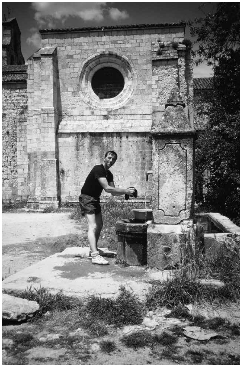
Corvée du lavage des vêtements, à San-Juan-de-Ortega.