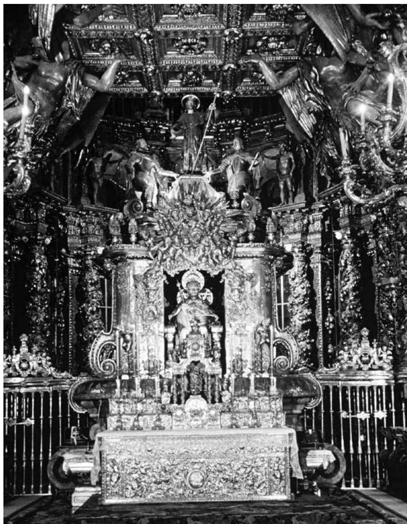
Le maître-autel de la cathédrale.

Après avoir contourné l'autel par la gauche, j'accède à un petit escalier qui descend dans la crypte directement sous l'autel. C'est là que je peux m'agenouiller et prier quelques instants sur le tombeau de saint Jacques. Je suis impressionné encore une fois par la richesse. Le sarcophage me semble être en or massif. Je ferme les yeux et je fais le vide en moi. Je dois avouer que je ne