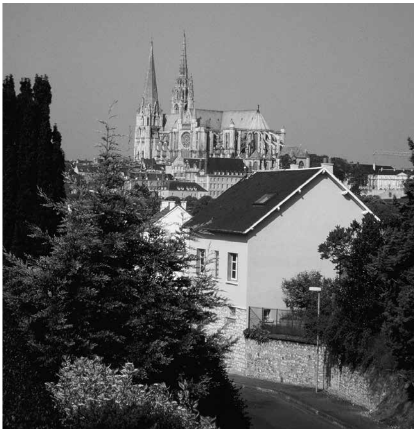
La cathédrale de Chartres.

suis très sensible à tout ce qui concerne mes origines, c'est très flatteur. Je soupçonne le recteur d'avoir pesé son choix; il se doutait de ma présence dans l'assemblée.