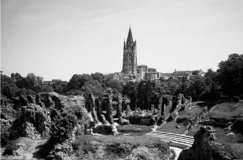
Église Saint-Eutrope de Saintes vue des ruines d'un amphithéâtre datant de l'époque romaine.

J'apprends que la ville de Saintes, après être tombée aux mains des Anglais par le traité de Brétigny, fut reconquise par Bertrand Du Guesclin en 1371. À l'évocation de Du Guesclin, mes fibres sensibles ont vibré. Je ne sais pas précisément ce que ce personnage évoque en moi, mais je sens quelque chose de viscéral. Je me souviens, quand j'avais sept ou huit ans, avoir vu à la télévision un film racontant son épopée. Je suis resté marqué par les exploits valeureux de ces chevaliers en armures à l'assaut des châteaux forts, se battant courageusement pour libérer la terre de France. Du Guesclin précurseur de Jeanne-d'Arc? Il me semble que j'aurais aimé vivre à son époque et me battre à ses côtés. J'ai l'impression très nette d'être en pays connu ici : c'est comme si j'y avais déjà vécu.