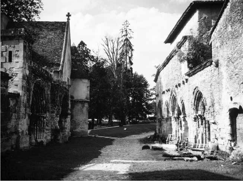
Les ruines du prieuré de Cayac, en banlieue sud de Bordeaux.