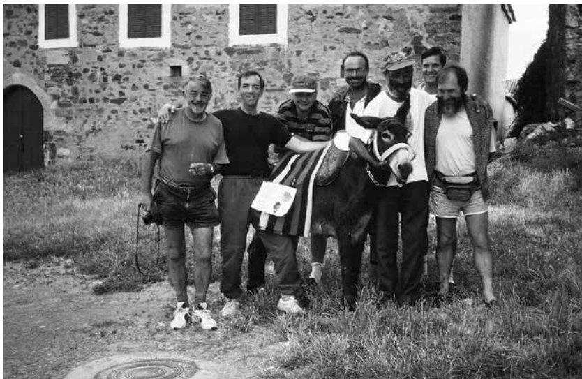
Groupe de pèlerins à Rabanal del Camino.