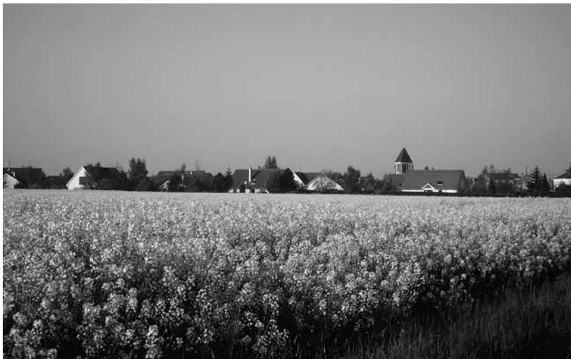
Champ de colza près de Gometz-la-Ville.

Le paysage change peu à peu et devient campagnard. C'est plus agréable. Ici, près de Gometz-la-Ville, je suis ébloui par le décor naturel qui s'offre à mes yeux. Les champs de colza sont en fleurs. Ces plantes cultivées principalement pour l'huile qu'on en tire atteignent près d'un mètre et sont fournies de petites fleurs jaunes. Ça donne l'impression d'un immense tapis jaune qui flotte au-dessus du sol. En arrière-plan se profile un petit village typique de cette région de France avec, évidemment, le clocher de la vieille église du XII e siècle. La photo à prendre vaut la peine de s'arrêter quelques minutes.