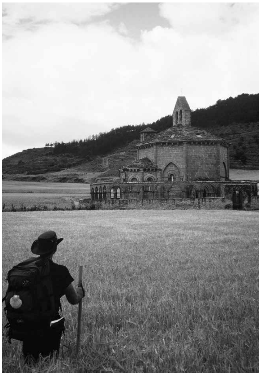
Chapelle romane d'Eunate construite au XII e siècle.