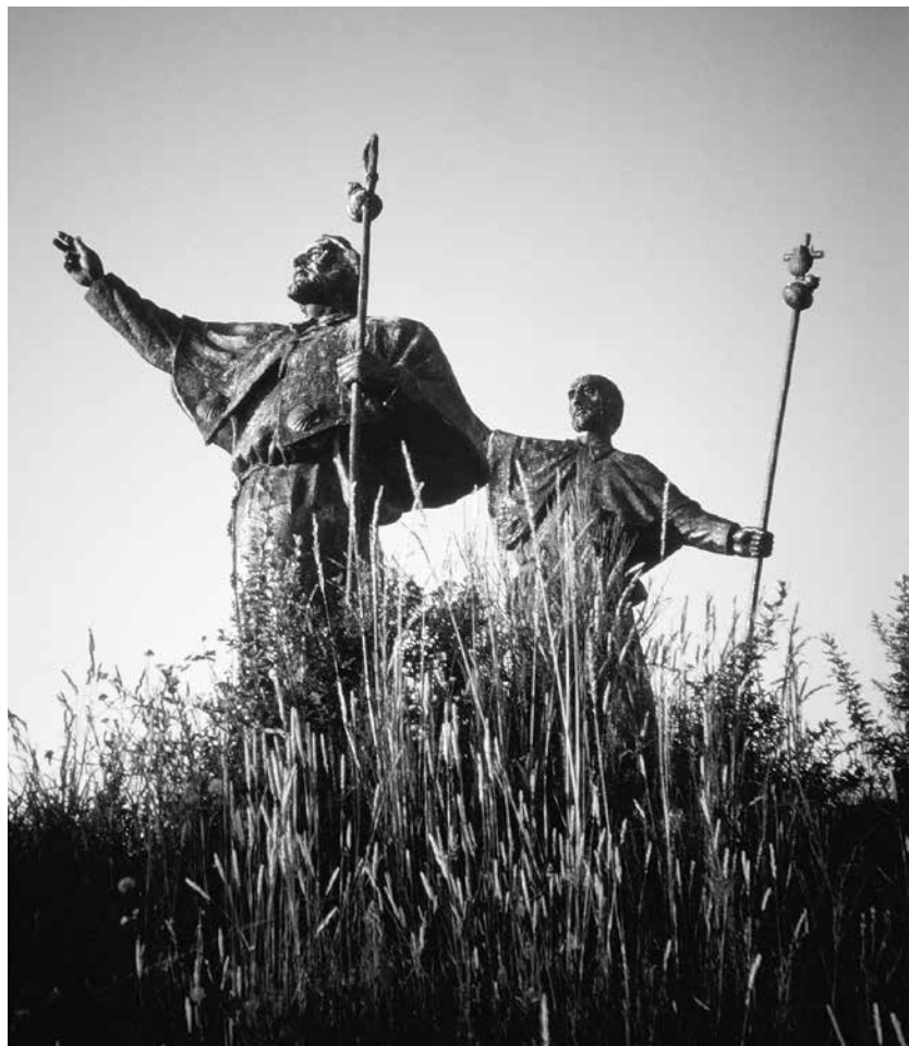
Sur le Mont de la Joie, statues géantes de pèlerins extasiés qui pointent du doigt vers la ville de Compostelle.

En attendant son retour, je visite le site. C'est très grand. Il y a un bâtiment uniquement réservé à la restauration, où plus de 500 personnes peuvent manger. De l'autre côté de la rue, un immense bar-café prend place. Plus loin, une série de boutiques offre tout ce que peuvent désirer pèlerins et touristes. Ici, c'est difficile de faire la différence entre les deux.